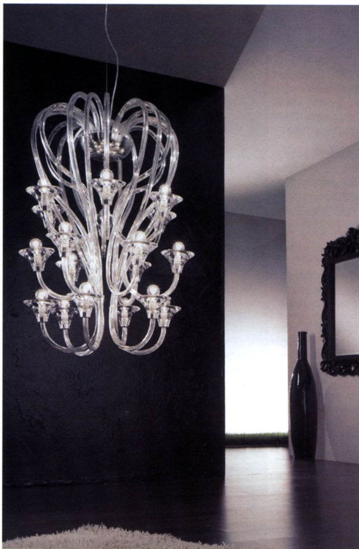
Una delle realizzazioni firmate da Voltolina

Voltolina, azienda di Olmo di Martellago, è oggi leader nella produzione di sistemi di illuminazione. Il segreto? Saper proporre il miglior design italiano coniugato alle esigenze più moderne del mercato mondiale.